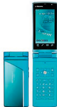
平成21年発売 富士通 1セグ受信携帯電話 F-01B