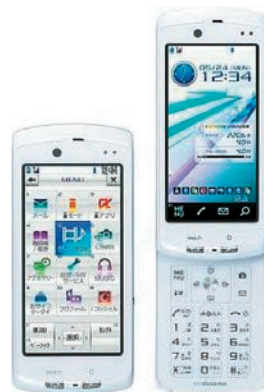
平成22年発売 富士通 1セグ受信携帯電話 F-04B