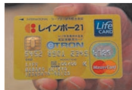
eTRONセキュリティーカード