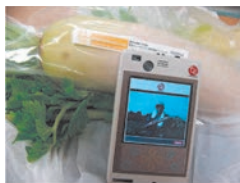
ユビキタスコミュニケーター